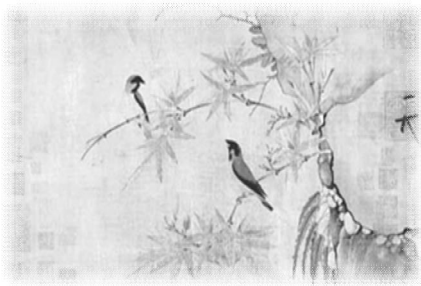
宋 赵佶 竹禽图

这曾是一个人们眼里不可能完成的任务——给分散在全球200多个收藏机构的1500多张中国宋代绘画制作一套“全家福”。